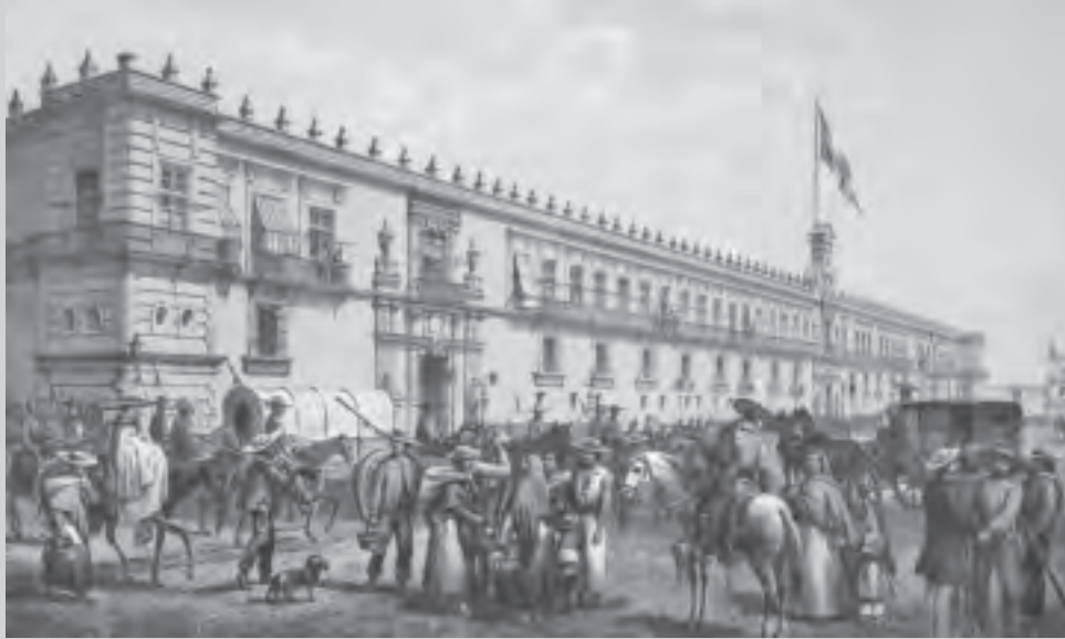
1° de enero de 1861. Ciudad de México. Obra de Casimiro Castro.