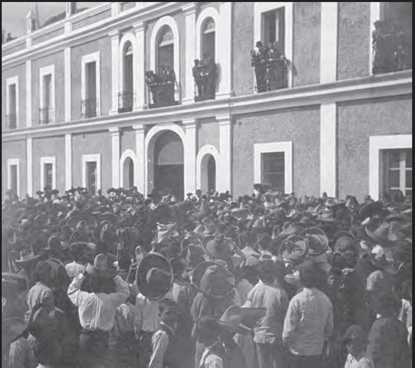
7 de enero de 1907. Fábrica de tejidos de Río Blanco, Veracruz.

El 7 de enero de 1907 estalló la huelga en la fábrica de tejidos de Río Blanco, Veracruz. Junto con la huelga de Cananea, Sonora, desarrollada en junio de 1906, fueron dos precedentes muy importantes para el estallido de la Revolución. Ambos movimientos fueron brutalmente reprimidos, con saldo de centenares de muertos. Hoy, 111 años después de esta movilización importantísima, las cosas no han cambiado, y el gobierno títere de Enrique Peña Nieto quiere cerrar con broche de hierro el conjunto de iniciativas antipopulares con la llamada Ley de Seguridad Interior (La Gestapo en México). Río Blanco, Cananea, la represión a los ferrocarrileros, médicos y maestros durante los 50 y los 60, la matanza del 2 de octubre, Aguas Blancas, La falsa guerra contra el narcotráfico, los 43 desaparecidos de Ayotzinapa, y las decenas de miles de víctimas del terrorismo estatal demuestran que la “democracia” siempre ha sido, en México, un espejismo, y que la lucha por una nación con justicia y dignidad es impostergable.