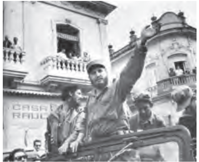
1º de enero de 1959. El Comandante Fidel Castro saluda al mundo.

La otra entrada que deseamos recordar se realizó en Cuba en 1959. Fidel Castro y Ernesto Che Guevara dieron un paso gigantesco en nuestro continente y que resonó en todo el mundo. Pero a diferencia de la nuestra, iniciada en 1910, la revolución cubana fue triunfante, y sigue siendo un símbolo de resistencia contra el imperialismo, representado ahora por la caricatura grotesca que es Donald Trump. El bloqueo contra Cuba y la guerra económica contra Venezuela nos demuestran que el enemigo no duerme, y que los pueblos tienen que buscar nuevas formas de organización, basadas en el conocimiento científico y en la historia concreta de cada país. Con todos los problemas y las limitaciones que puedan haberse dado en la patria de José Martí, el impulso a la educación y la medicina desarrollado en Cuba, por sólo mencionar estos dos rubros, es asombroso, mayor incluso que en países con enorme potencial económico como México y Brasil.