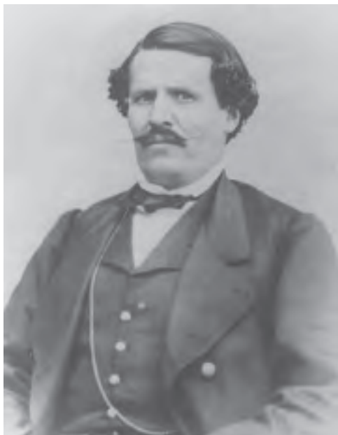
General Jesús González Ortega, héroe proscrito de la historia oficial.

Inicia 2018. Y más que desear felicidad y prosperidad, lo que mejor puede desearse a nuestro prójimo es un Feliz y Combativo Año Nuevo. Que la llama de la rebeldía no se apague en los corazones irredentos. Porque ante la embestida del imperialismo y de los vendepatrias apoderados del país, el mejor deseo es no caer en la complacencia de las bestias apacibles, de los rebaños enajenados y sometidos. Por eso, este primero de enero queremos recordar dos entradas triunfales realizadas en las dos centurias pasadas. La primera es el arribo a la ciudad de México, en 1861, del Ejército Constitucionalista al frente del general Jesús González Ortega, después de derrotar a los conservadores el 22 de diciembre en Calpulalpan. Él en verdad fue el héroe de la Guerra de Reforma, y no Juárez, quien cultivó un enorme rencor contra este guerrero. González Ortega también estuvo en la defensa de Puebla contra el ejército de Napoleón III, y sólo después de dos meses, ante la ausencia de parque y suministros, tuvo que entregar la plaza. Pero como él y Santos Degollado le exigieron a Juárez su renuncia por el tratado McLane-Ocampo, que prácticamente convertiría a México en protectorado de los Estados Unidos, el de Guelatao jamás le perdonó esto, por lo cual González Ortega fue proscrito de la historia oficial. Llor a este general, héroe auténtico de la patria que las camarillas corruptas del PRI y el PAN y sus partidos paleros prácticamente han desahuciado. AZCH.