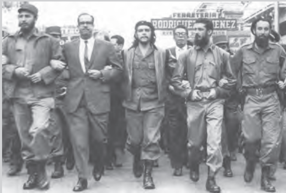
1° de enero de 1959. La Habana, Cuba. "La patria es nuestra, chico."