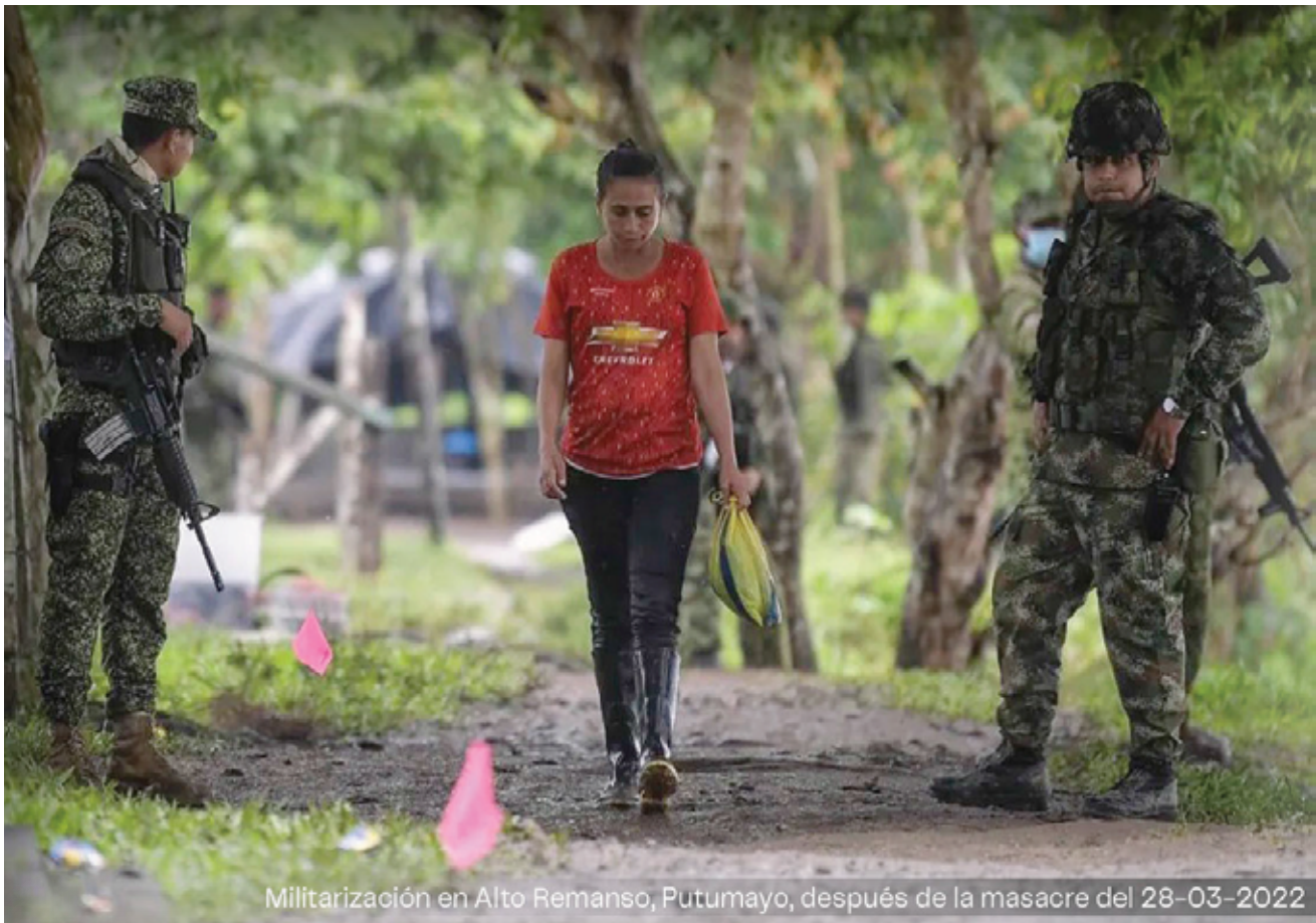
Militarización en Alto Remanso, Putumayo, después de la masacre del 28-03-2022

El gobierno de la esperanza ha iniciado las reformas que se anunciaron en campaña. Salud y trabajo, donde las EPS funcionan como empresas privadas bajo el desgastado y corrupto modelo neoliberal de privatizar un derecho universal como la salud, donde un puñado de familias y capitalistas se enriquecen en cuenta del presupuesto público.