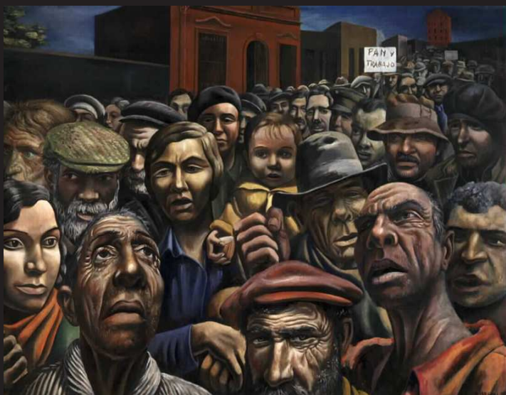
A. Berri, 1934: Manifestación y desocupados

Dime, ¿qué madura el destino de aquel que da vueltas y vueltas en torno a la fábrica (en su lugar, una mujer hace cartuchos, o acaso un chico de cabeza pálida, y en vano el hombre mira a través de la cerca, en vano lleva en sus hombros la carga: si está dormido lo despiertan y si roba lo atrapan)?