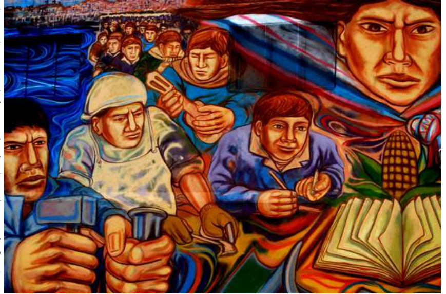
Fragmento del mural «Caleta Mestiza» del artista peruano Olfer Leonardo

A pesar de ello, el kirchnerismo encarna un proyecto neodesarrollista asentado en el extractivismo, la sojización, y la precarización laboral, que jamás podrá expresar un proyecto de transformación profunda para nuestro pueblo. Nuestro desafío sigue siendo generar una alternativa superadora por izquierda al kirchnerismo y a cualquier proyecto dominante en Argentina. Otro