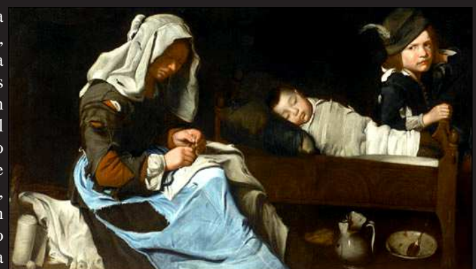
Obra de artista anónimo del norte de Italia mediados del siglo XVII

sangre manaba dentro de su trémula boquita. Así me hallaba yo sentada un día, cuando entró de repente nuestra casera -a quien en el curso del invierno habíamos pagado más de 250 táleros, y con quien habíamos convenido por contrato que el dinero de fecha posterior le sería abonado no a ella, sino a su propietario, quien le había trabado embargo con anterioridad-, negó el contrato, exigió las 5 libras que aún le adeudábamos, y puesto que no disponíamos de las mismas en el acto (la carta de Naut llegó demasiado tarde), entraron dos embargadores en la casa, trabaron embargo sobre todas mis pequeñas pertenencias, las camas, la ropa, los vestidos, todo, hasta la cuna de mi pobre niño, los mejores juguetes de las niñas, quienes se hallaban arrasadas en ardientes lágrimas. Amenazaron con llevárselo todo en un plazo de dos horas; yo yacía en el suelo, con mis hijos ateridos de frío y mi pecho dolorido. Schramm, nuestro amigo, acudió de prisa a la ciudad para procurarnos auxilio.