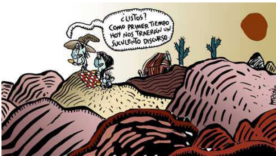
La Jornada 21/01/2013

-Preparación de un paquete fiscal que intenta elevar el IVA incorporando alimentos y medicinas a la carga que pesa sobre los consumidores cautivos de los bienes indispensables para la subsistencia.