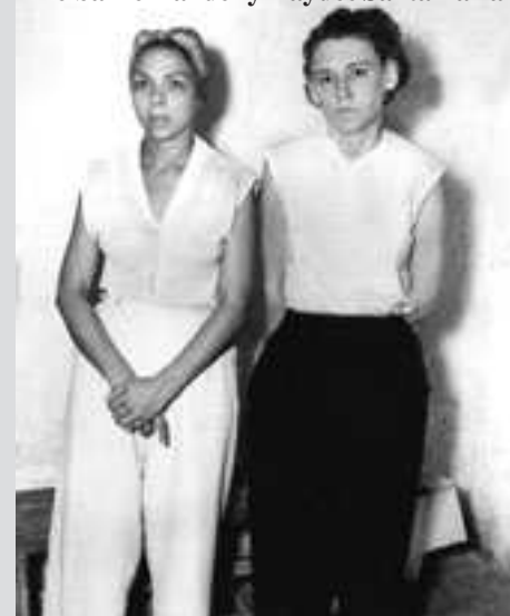
Melba Hernández y Haydée Santamaría

el puerto de Tuxpan, a los expedicionarios del Granma.