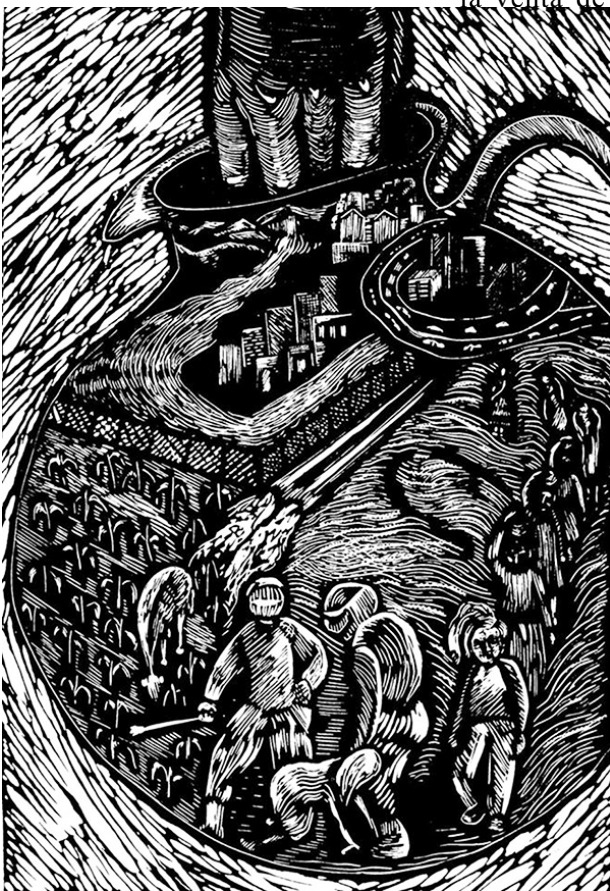
Grabados de Escuela Mártires del 68

Del libro colectivo: 43 poetas por Ayotzinapa