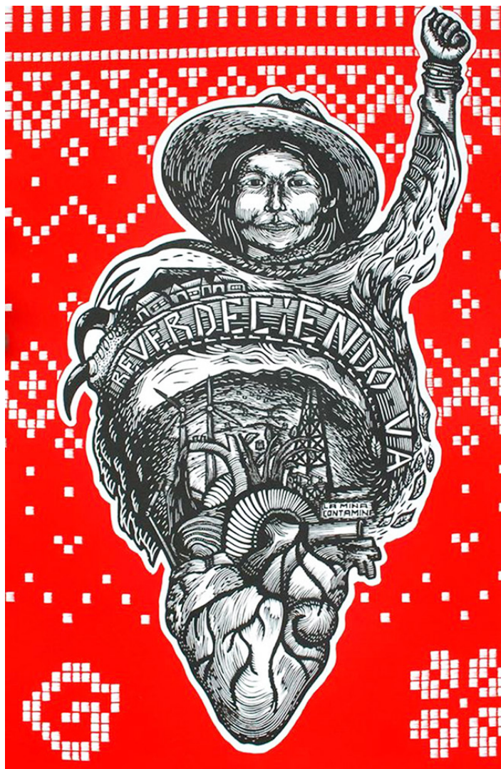
Grabado de la Escuela Mártires del 68