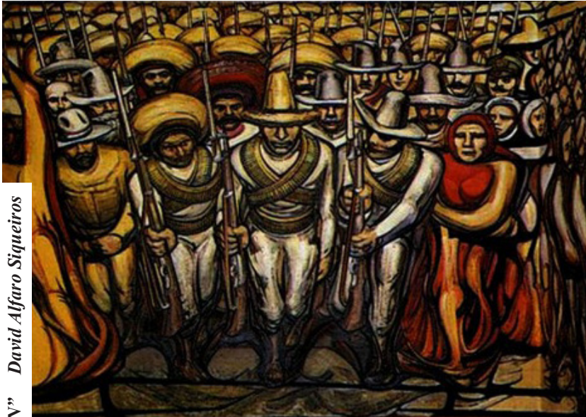
David Alfaro Siqueiros

Número 140 ★ Septiembre 2015 ★ COOPERACIÓN VOLUNTARIA