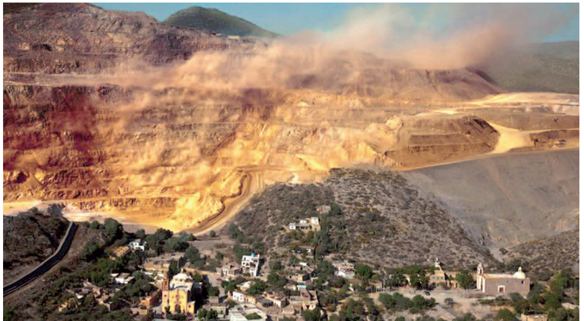
Desaparición del Cerro San Pedro, MInera San Xavier, San Luis Potosí

El involucramiento de la población organizada En la historia de América Latina, la resistencia ante el despojo no es nueva. Ella se nutre de la unión de capacidades y sectores, y se basa en información sólida y verdadera. El sentir común hace posibles los movimientos sociales. Sólo el compromiso genera sociedades incluyentes, justas y democráticas.