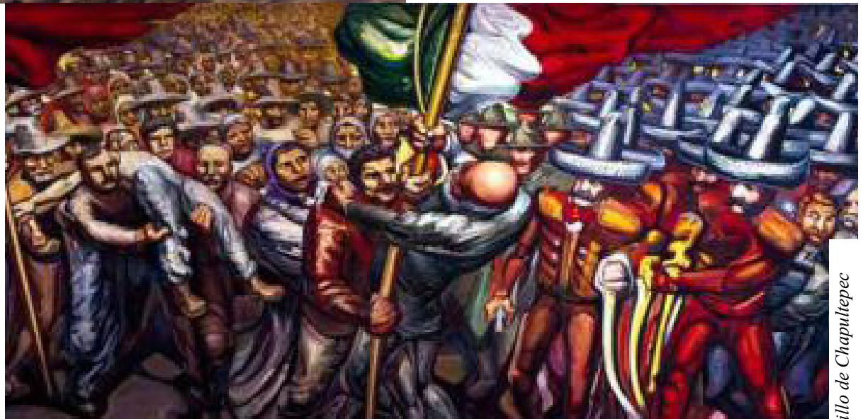
Museo Nacional de Historia del Castillo de Chapultepec

Que el gobierno privilegia a un grupo de traficantes políticos, que se entrega a los cortesanos y politiqueros, a quienes enriquece con el despilfarro de las rentas públicas, con exención de contribuciones y con el monopolio de las empresas más productivas de nuestra industria. (11 de abril de 1903)