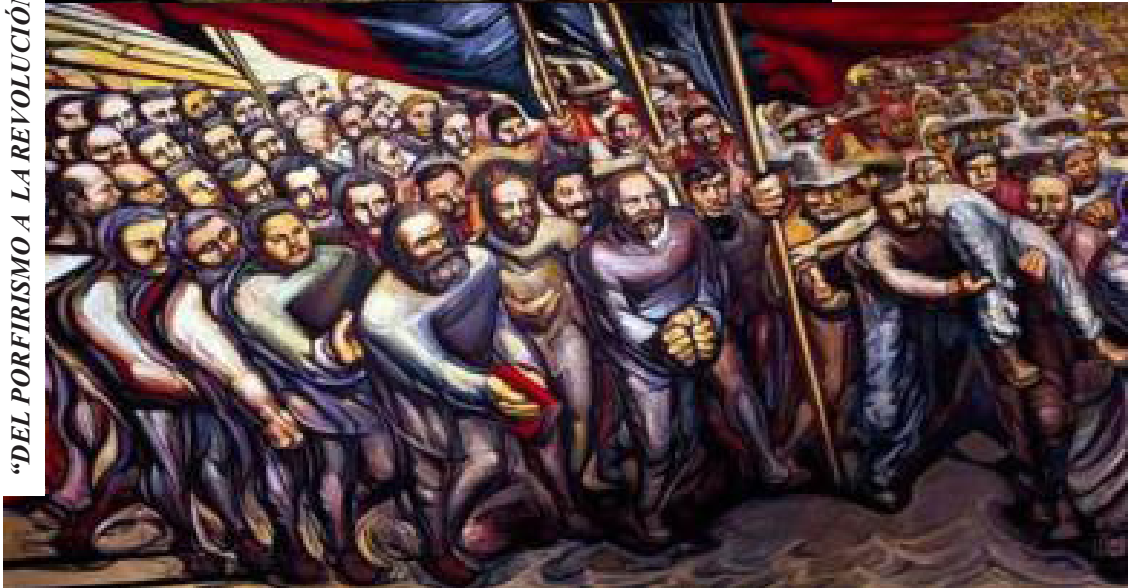
“DEL PORFIRISMO A LA REVOLUCIÓN”

Falta dinero para la instrucción, sí, pero no falta para el militarismo, pero no falta para los poderosos, no falta para todos los parásitos del país. (1 de marzo de 1903)