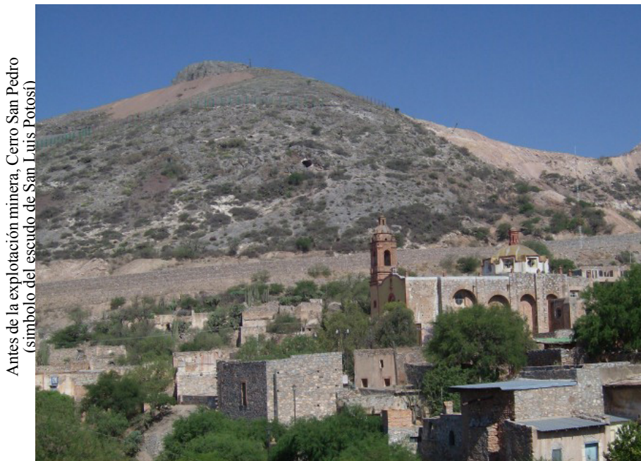
Antes de la explotación minera, Cerro San Pedro (símbolo del escudo de San Luis Potosí)