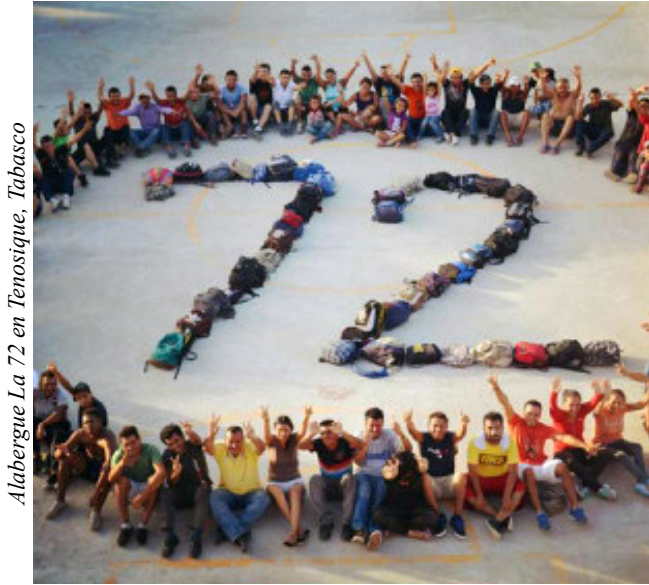
Albergue La 72 en Tenosique, Tabasco