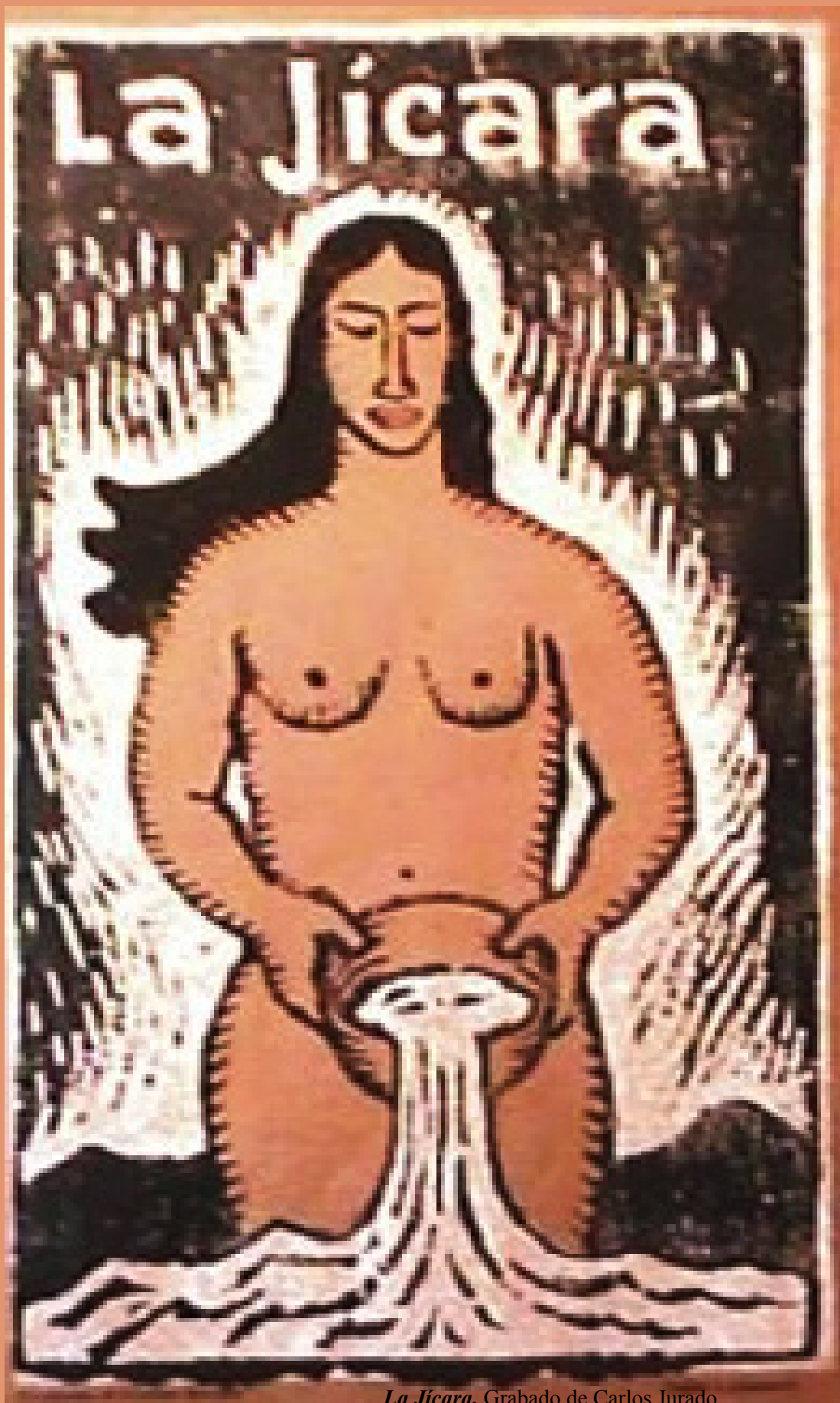
La Jicara, Grabado de Carlos Jurado

Dice mi padre que puede leer en las manos del pueblo el destino y que no hay asesino ni rey que le pueda marcar el camino que va a recorrer.