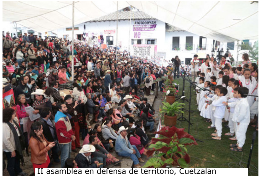
II asamblea en defensa de territorio, Cuetzalan

No se puede detener el goteo que hace lluvia, los arroyos que hacen ríos y van a formar mares y océanos. Sólo retarda el proceso el olvido de la fuerza protagónica de los pueblos organizados, olvidar seca la imaginación y el sueño libertarios. Que el agua de los pueblos no deje de moverse, desde abajo, desde ahora, hasta la victoria.