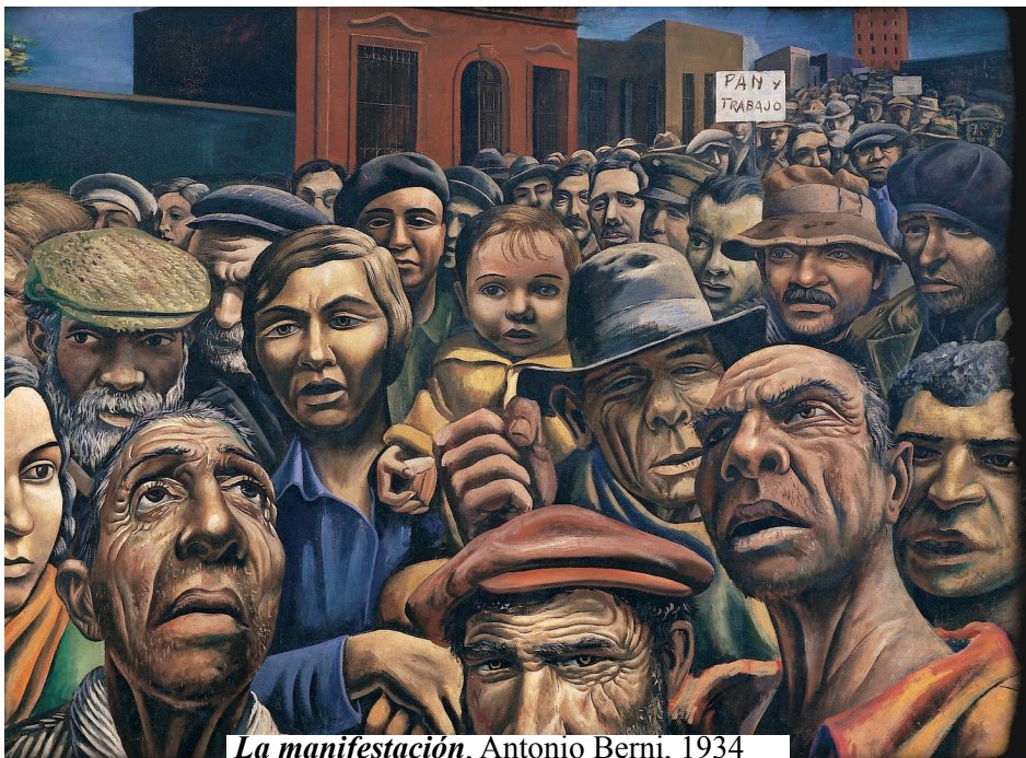
La manifestación, Antonio Berni, 1934

* Eduardo Galeano: El diablo es pobre en ESPEJOS.