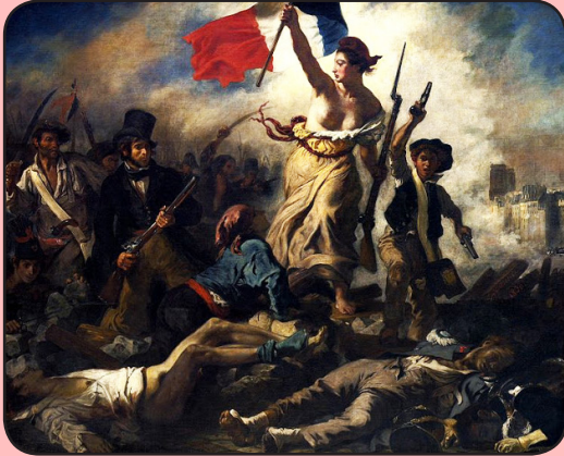
La libertad guiando al pueblo, Eugene Delacroix