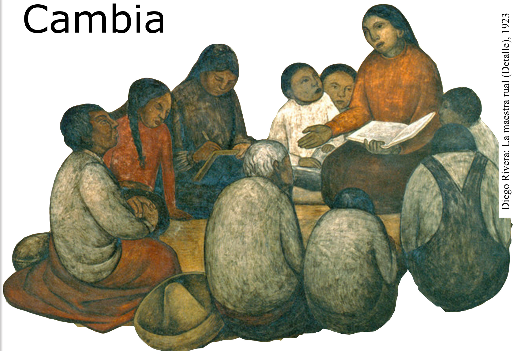
Diego Rivera: La maestra rural (Detalle), 1923