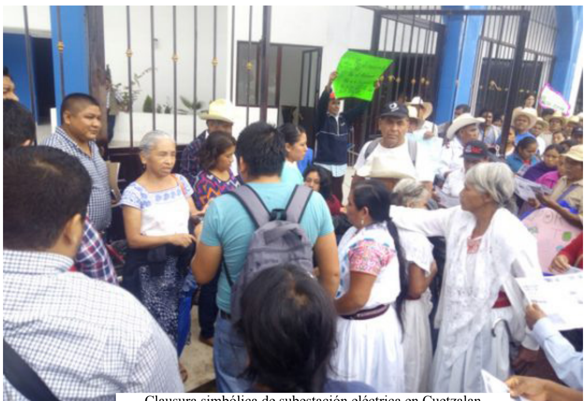
Clausura simbólica de subestación eléctrica en Cuetzalan

En los resolutivos de la asamblea, el presidente municipal se comprometió a suspender la obra de manera inmediata y se programó una reunión el 31 de octubre para dirimir las inconformidades. Antes, los asistentes propusieron realizar una clausura simbólica en el sitio en donde se confirmó se están realizando las obras de una subestación eléctrica. Partió el contingente y en un ambiente de respeto. Desde la vía pública se realizó esta cancelación simbólica. En el lugar estaban presentes tres empleados de la empresa constructora a quienes se les explicó el acto y se les informó del acuerdo que se había tomado minutos antes con las autoridades municipales. Con base en nota de Martín Hernández Alcántara para La Jornada de Oriente