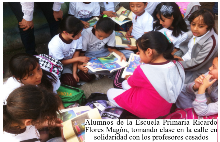
Alumnos de la Escuela Primaria Ricardo Flores Magón, tomando clase en la calle en solidaridad con los profesores cesados

En palabras de Eduardo Galeano "Mucha gente pequeña en lugares pequeños, haciendo cosas pequeñas pueden cambiar el mundo". Para los profesores que hacen estas acciones, está claro que la lucha sigue siendo contra la reforma educativa, sigue como defensa de la educación, que la represión es parte de la guerra del capital contra el pueblo y es necesario enfrentarla, aunque, si no lo saben a ciencia cierta, lo están aprendiendo en la propia lucha. También tienen claro que estas acciones pequeñas se necesitan engarzar, articular con otras acciones pequeñas y no tan pequeñas, con la lucha de otros, que es la misma lucha contra este sistema de dominación.