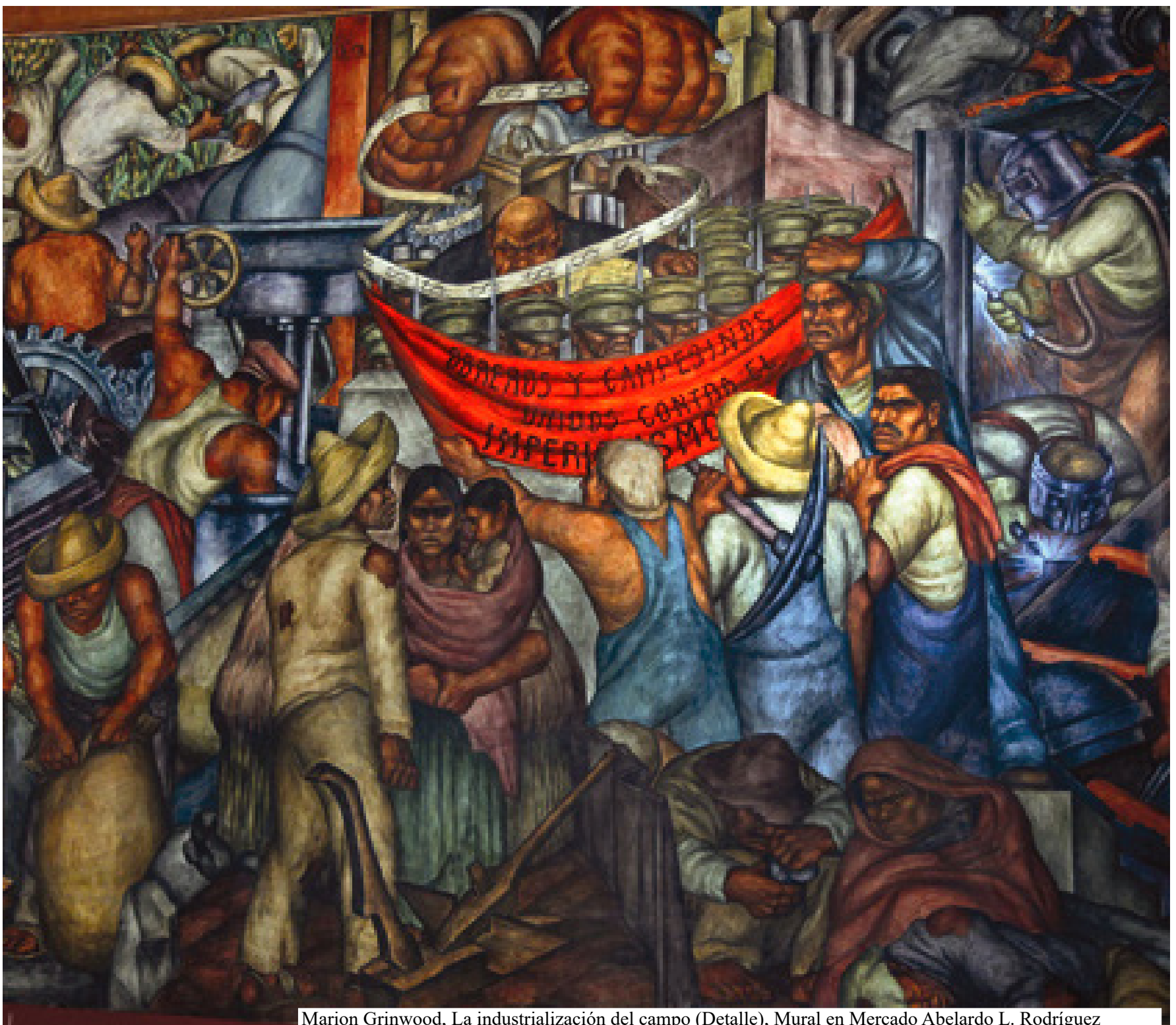
Marion Greenwood, La industrialización del campo (Detalle), Mural en Mercado Abelardo L. Rodríguez

...y nosotros no queremos que la historia nos reproche, o nos pueda reprochar, que ante razones poderosas nos dejásemos sorprender. (...) los pueblos que luchan por su liberación no pueden descuidarse nunca (...) los pueblos que luchan por una gran aspiración y por una muy justa aspiración, no pueden hacerse ilusiones.