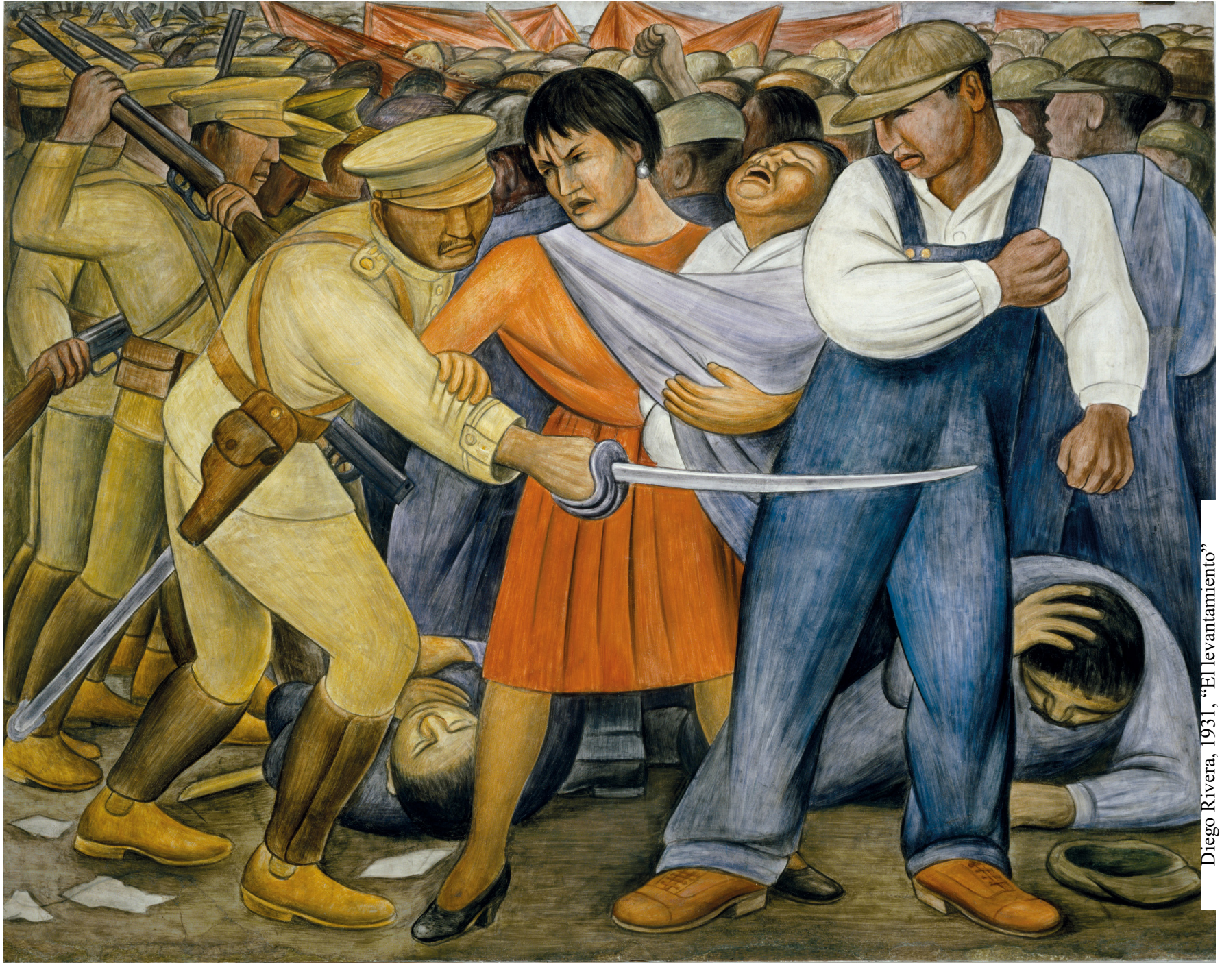
Diego Rivera, 1931, "El levantamiento"