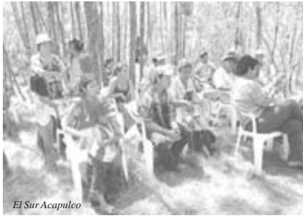
El Sur Acapulco