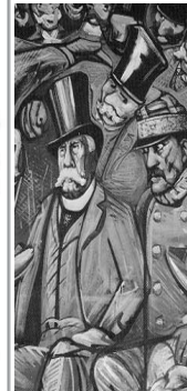
Fuentes: Investigaciones de Edgar González Ruiz, Ricardo Pérez Montfort y del periodista Álvaro Delgado. Síntesis de La Ultraderecha en el gobierno mexicano x Chk García - [03.05.04 ] www.lahaine.org