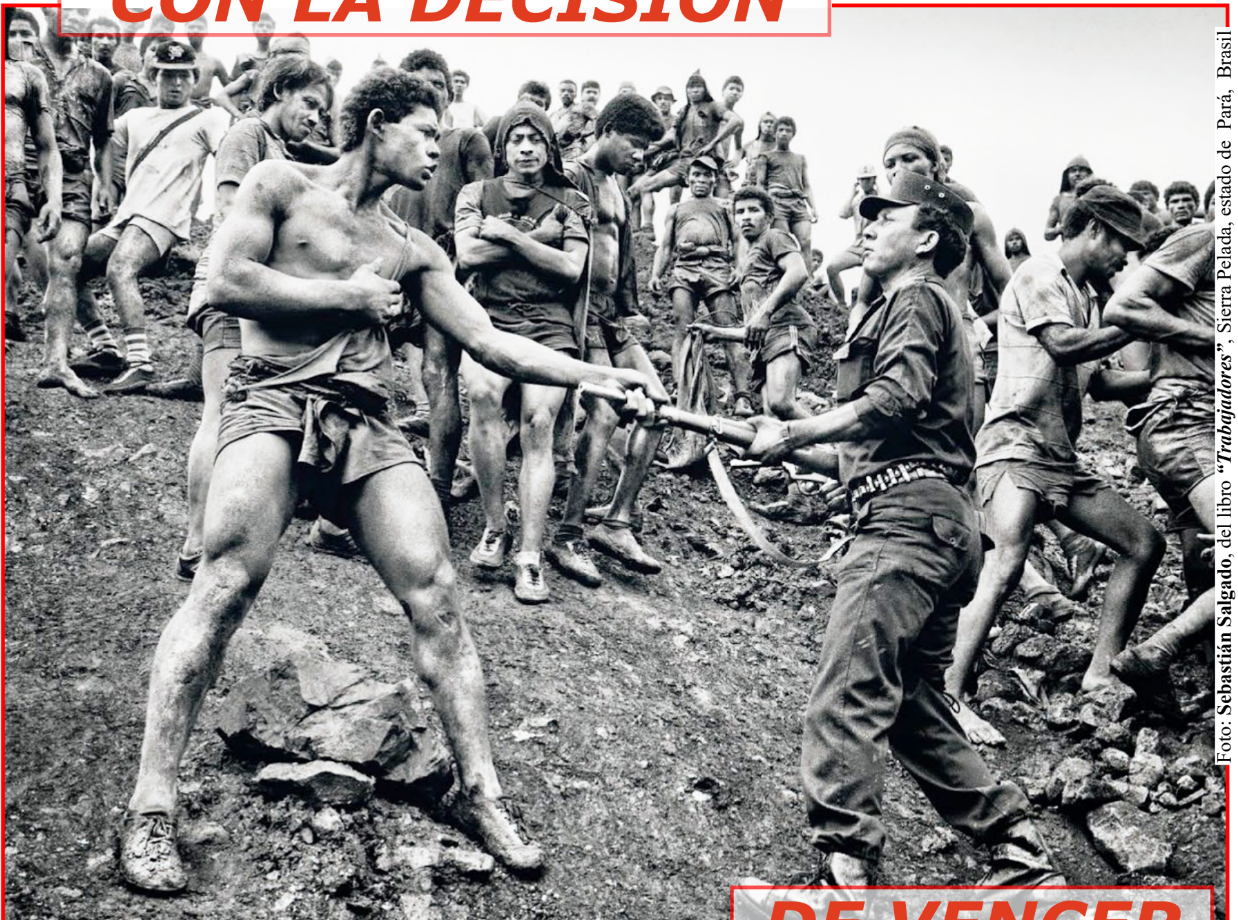
Foto: Sebastián Salgado, del libro "Trabajadores", Sierra Pelada, estado de Pará, Brasil