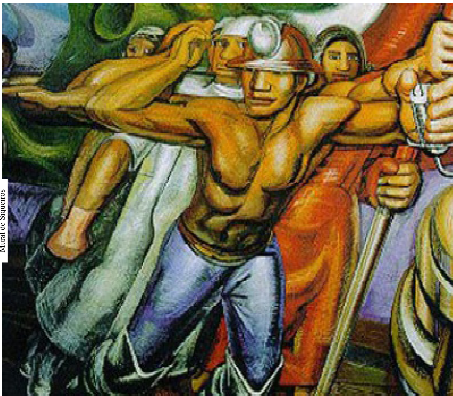
Mural de Siqueiros

Nuestra esperanza sólo puede venir de los sin esperanza (Consigna del mayo francés, 1968)