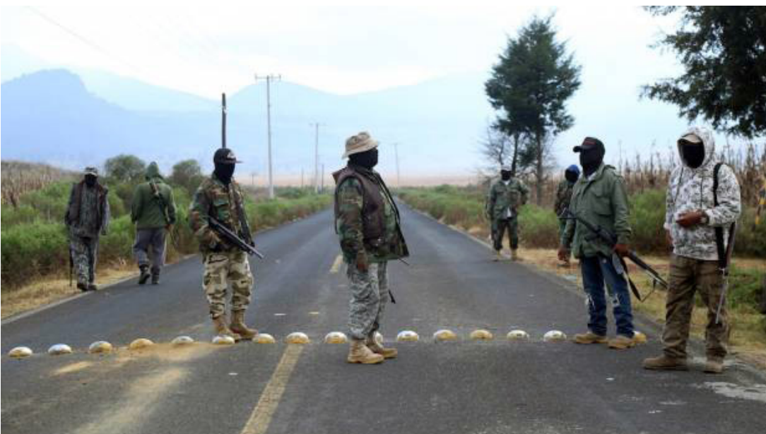
Ronda Comunitaria Nurio Michoacán

Con información de la Comunidad de Nurio, medios libres y en-ruptura colectiva.