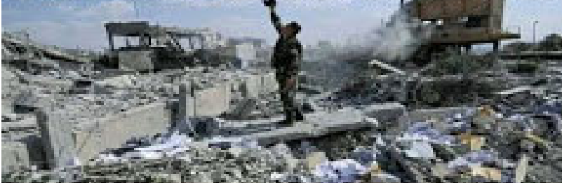
¡Se incendia Notre Dame! ...Ah, no, que estas son fotos de Siria Bombardeada por Francia, Reino Unido y EEUU

Habrán avances y retrocesos hasta que logremos vencer al monstruo capitalista que gobierna nuestras vidas y destruye el mundo. Cuando triunfemos y llegue la verdadera democracia directa, sin Estado, jefes o representantes; cuando administremos nuestras vidas y lugares de residencia, entonces decidiremos qué es lo necesario, lo vital, lo importante. Será entonces cuando los mercados, las ganancias y el dinero se conviertan en antiguos recuerdos. Y la humanidad vivirá en la edad de la cultura, podrá recorrer todo su patrimonio, sabiendo que es bella, digna y que observa al mundo a hombros de esos gigantes que la precedieron.