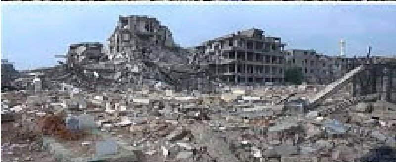
Los medios del Capital dictan lamentos sin fin por la catedral de París; pero cuando los países imperialistas bombardean y devastan otros países, esos mismos medios dictan que hay que "apaludir" lo que cínicamente llaman "bombardeos humanitarios", dictan aplaudir invasiones y saqueo. La muerte de millones de personas y la destrucción de ciudades patrimonio de la humanidad, barbarie perpetrada por el imperialismo estadounidense y europeo, es encubierta.