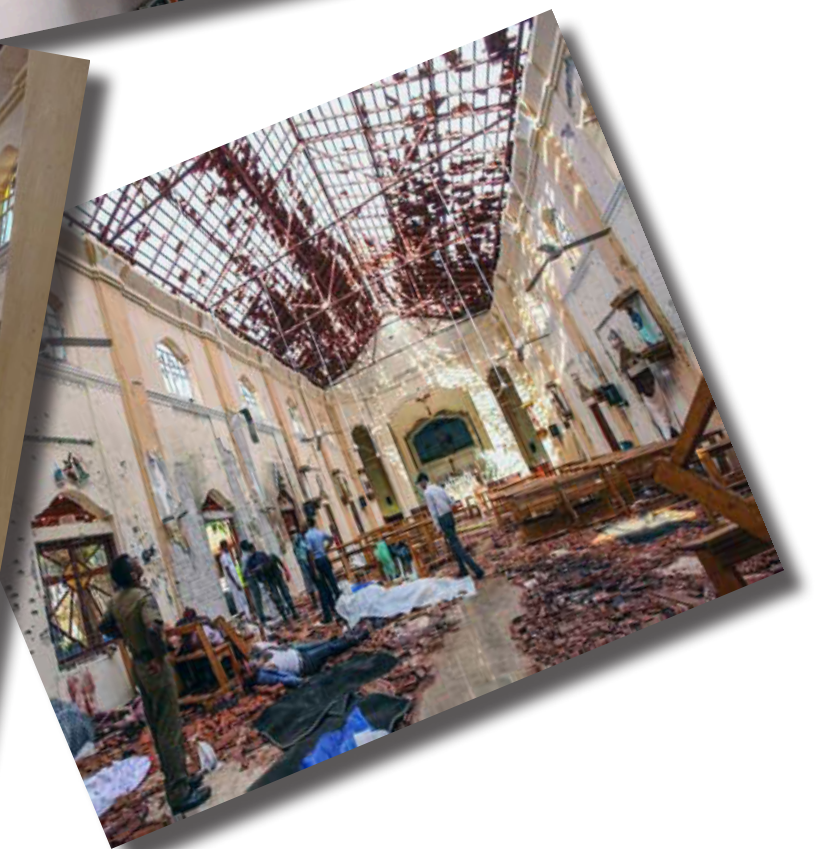
Atentado en Sri Lanka