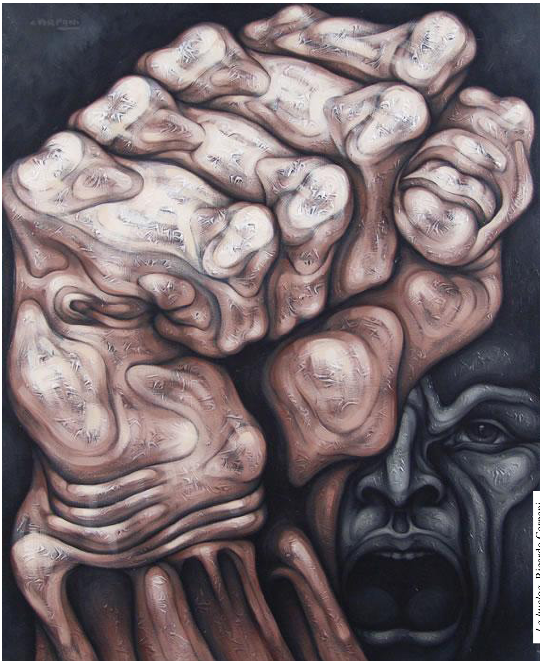
La huelga, Ricardo Carpani

Quien lucha, puede perder; quien no lucha, ya ha perdido