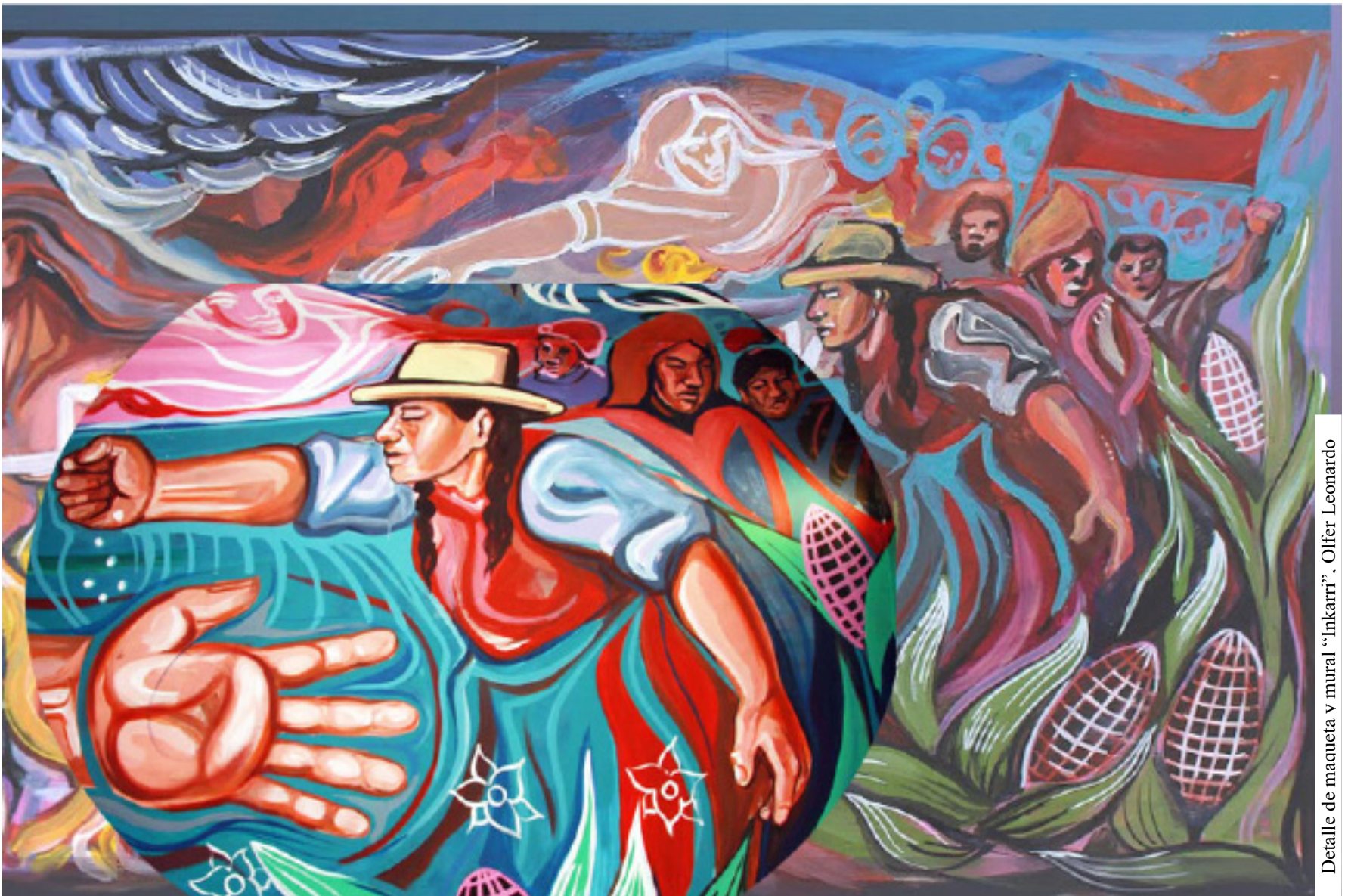
Detalle de maqueta y mural "Inkarri". Olifer Leonardo

...ponerlo todo al servicio de la lucha Ernesto Che Guevara