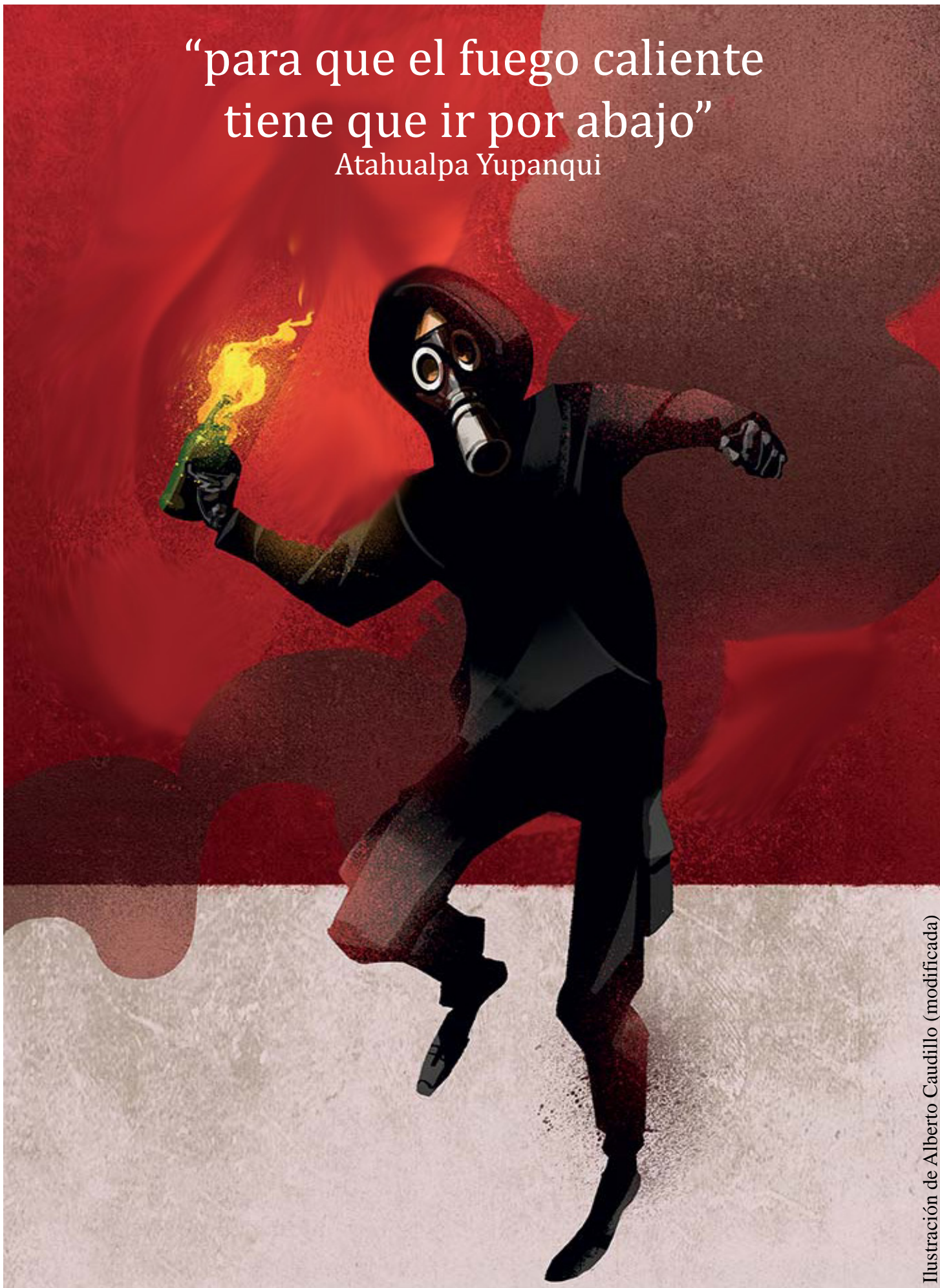
Ilustración de Alberto Caudillo (modificada)

“para que el fuego caliente tiene que ir por abajo” Atahualpa Yupanqui