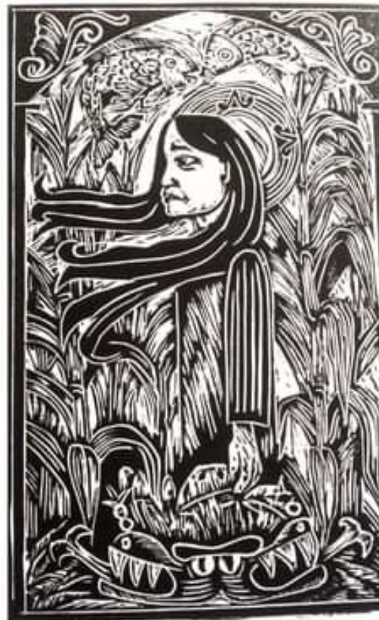
Grabado: Talleres Populares 28 de Junio

“No sentirás más y recordarás a tus dioses cada día en la eternidad”, le prometen.