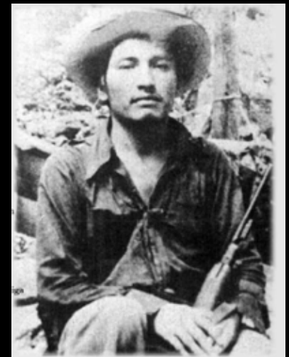
*Colectivo PLOMO CGH-UNAM 1999-2000

Ahora si cuidense opresores pues Lucio anda con la flaca defendiendo la lucha de los pobres y gritando ¡aquí nadie se raja!