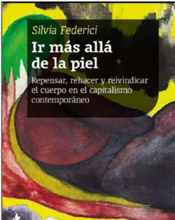
(Fragmentos del libro “Ir más allá de la piel”. Tinta Limón, 2022)