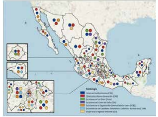
Cartografía del crimen organizado en México. 2019