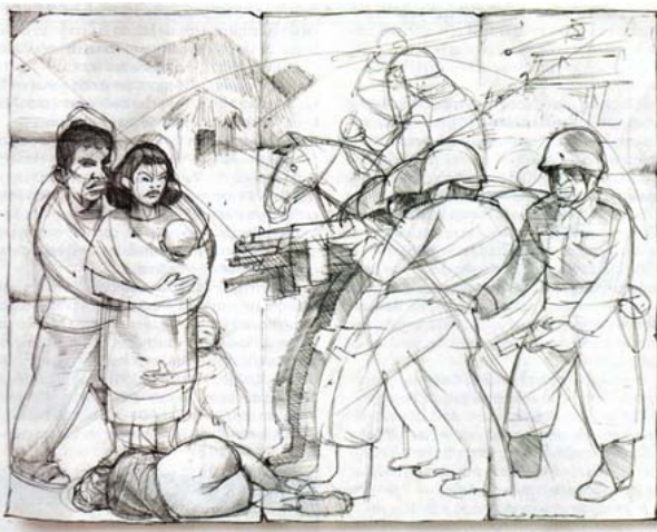
Mono Sapiens, Proceso 1599

«Por conducto de la Comisión de Gobierno de esta legislatura, se recibieron diversas peticiones formuladas por organizaciones sociales, en las que solicitan que esta soberanía popular haga una revisión de la Ley de Amnistía, en virtud de que a su juicio la misma no ha cumplido con las expectativas sociales