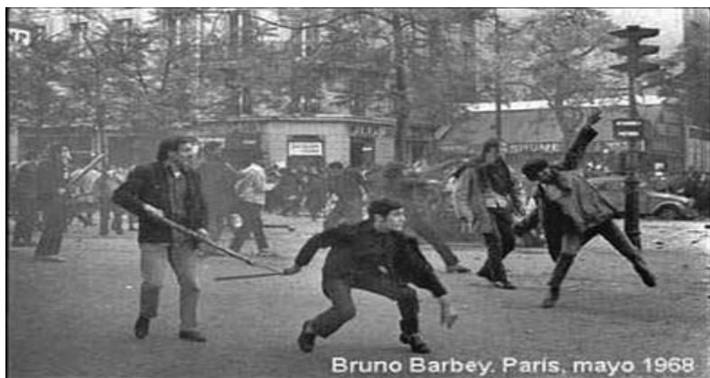
París, mayo 1968