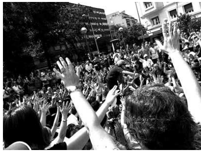
«Silencio, estamos en democracia»