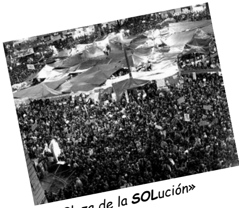
«Plaza de la SOLución»