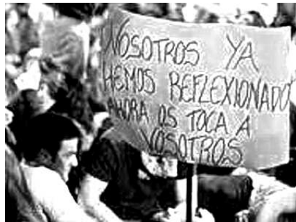
«Violencia es no llegar a fin de mes»