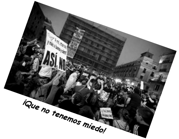
«¡Que no tenemos miedo!»