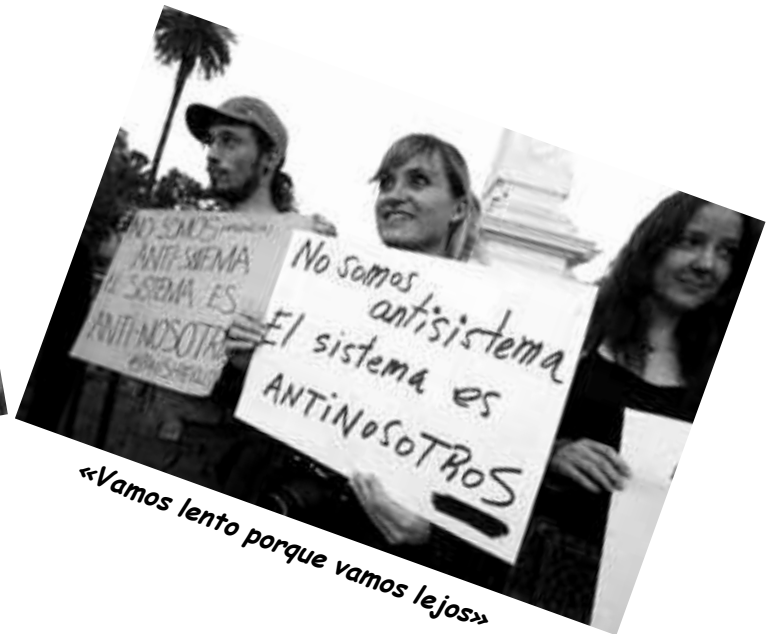
«Vamos lento porque vamos lejos»