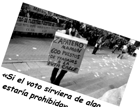
«Si el voto sirviera de algo, estaría prohibido»