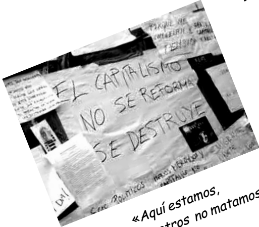
«Aquí estamos, nosotros no matamos»