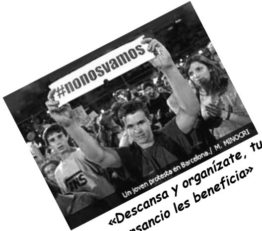
«Descansa y organízate, tu cansancio les beneficia»