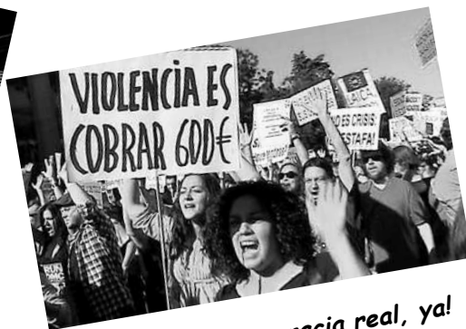
«¡Por una democracia real, ya!»