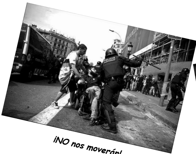
«¡NO nos moverán!»